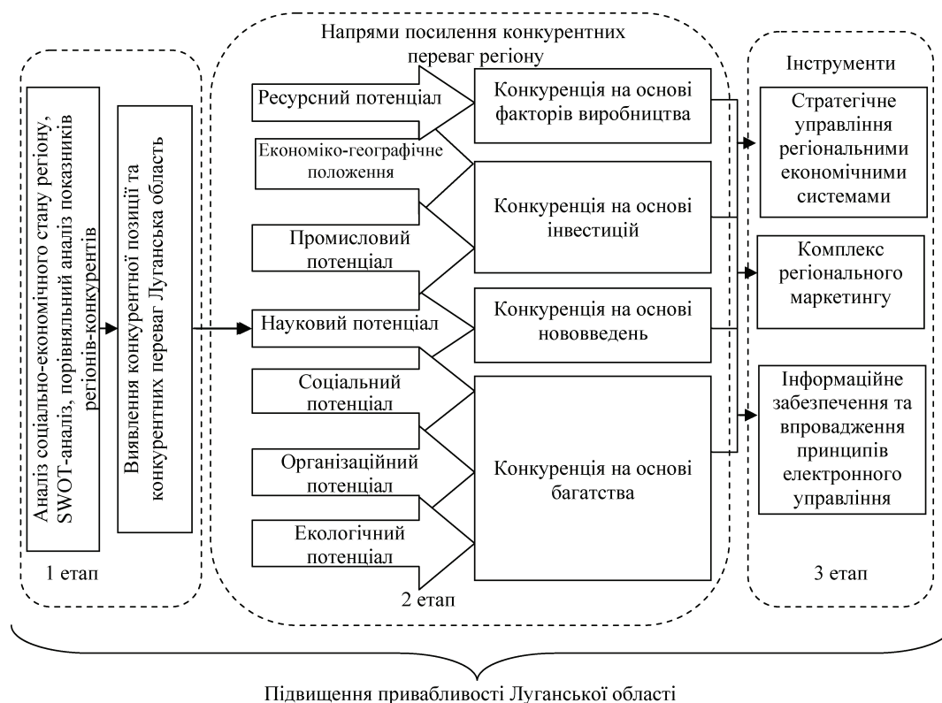
Рис. 2. Напрями та інструменти посилення конкурентних переваг регіону (власна розробка автора)

ваг регіону з метою подальшого їх посилення. Результатом цього етапу стало визначення рейтингу Луганської області за рівнем розвитку.