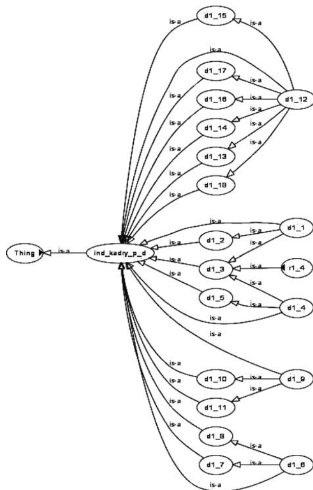
Рис. 1. Схема семантичної мережі з ієрархічним розташуванням вершин кадрового потенціалу ЕКБП

Висновок. Використання MIVAR простору дозволяє навести в базі знань ЕКБП знання про кадровий потенціал та здійснити автоматичну побудову семантичних мереж. Накладаючи обмеження на опис вершини дуг, можна одержати мережі різного виду. Одна з основних відміннос-